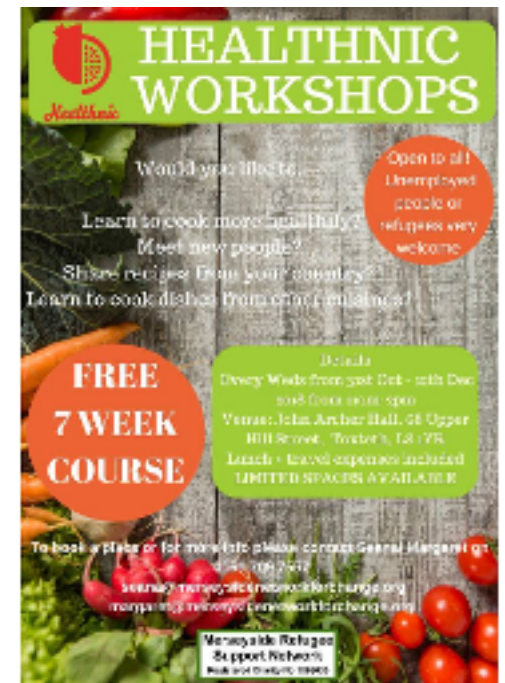
Plakat z warsztatów w Wlk. Brytanii